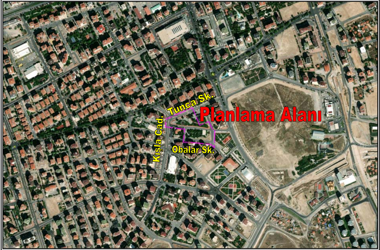
Resim 1: Planlama Alanının Konumu

Planlama alanı; düz bir arazi yapısına sahiptir. Bahse konu alan üzerinde park ve yeşil alanlar bulunmaktadır. Planlama alanının yakın çevresinde ise cami, sağlık ocağı, konut ve işyeri kullanımlı yapılar ile park yer almaktadır.