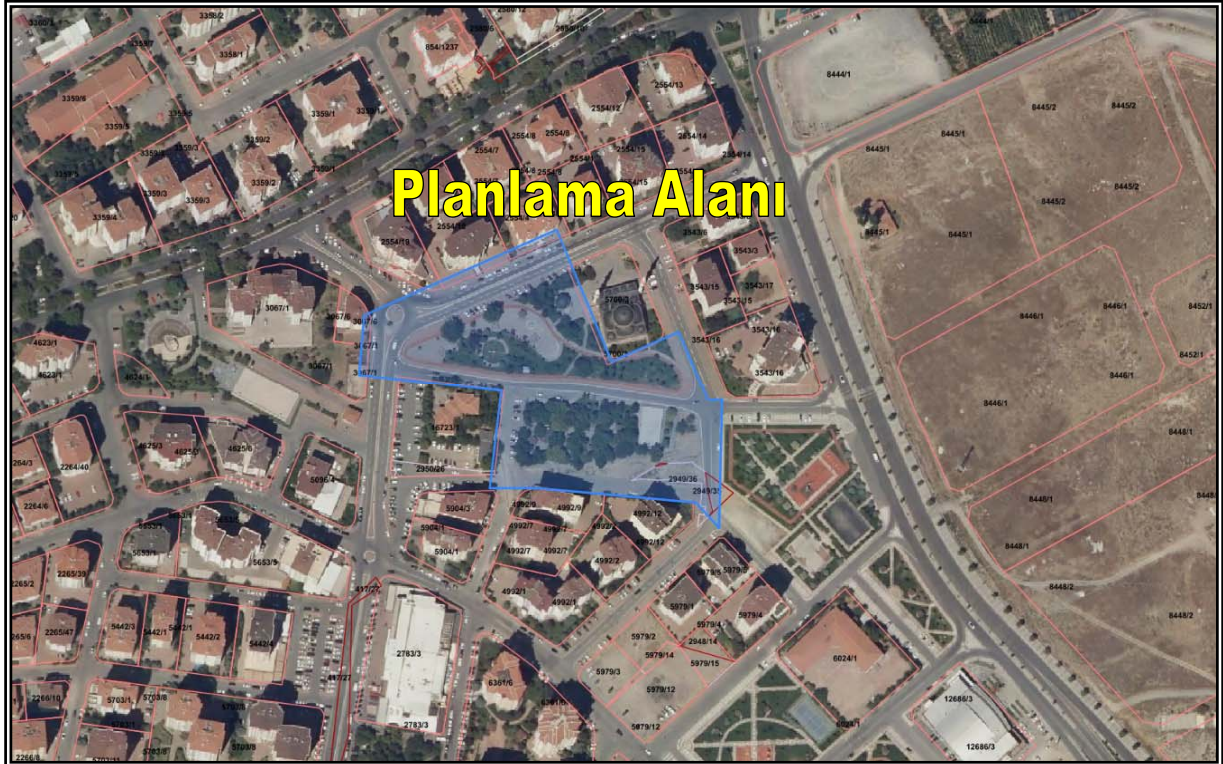
Resim 3: Planlama Alanı Mülkiyet Durumu

Planlama alanı; tapuda Melikgazi İlçesi, Köşkdağı ve Alpaslan Mahallesi sınırları içerisinde, 5700 ada 3 parsel numaralı taşınmazın güneyinde tescile tabi olmayan kamu arazileri üzerinde yer almaktadır. (Bkz. Resim 3)